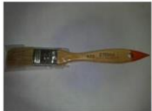
Gambar 2. Kuas ukuran 1"